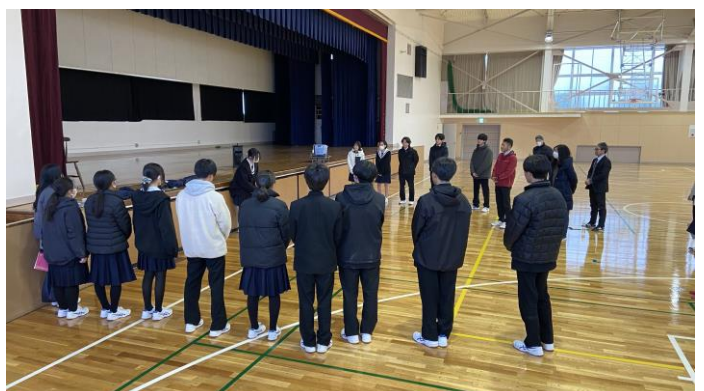
1年間の思いを総合委員へ述べる総合委員長