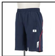
ハーフパンツ 3,000円（税込）