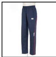
ジャージ（下） 3,700円（税込）