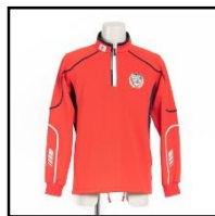
ジャージ（上） 5,300円（税込）

→A.10枚で1セットです。すべてのアイテムに取り付けが必要です。こちらは無料でご用意いたします。取付位置につきましては、納品の際に資料を同梱いたします。また、ネームシートを追加で購入される場合は有償（税込1,000円）になりますので紛失などにはご注意ください。