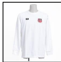
（希望購入品）長袖シャツ 3,000円（税込）

【個人情報の取り扱いについて】受け取った個人情報は、申し込み商品を間違いなく製造及びお渡しするために使用し、それ以外の目的には使用いたしません。社内管理規定を遵守し、且つ適切に管理いたします。