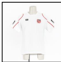
半袖シャツ 2,900円（税込）