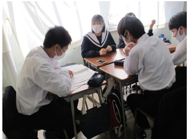
時間を測りながらプレゼンの練習中

その一方で、1月に行われる主張のプレゼンのための発表資料を作成している人もいました。Google スライド、Keynote、PowerPoint を使って作業を進めていますが、まだなかなか慣れていないので苦労している様子でした。スライドのラフ案を見ていると、発表が楽しみになってきます。今年度のクライマックスに向かって、各班がまとめの表現活動に精一杯取り組んでいます。