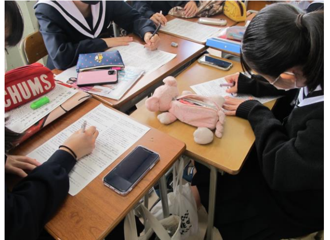
プレゼンの台本を全員でチェック

すべての班が先週までにインタビュー新聞を無事に完成させることができました。今回はインタビュープレゼンに向けての最終調整を行っている班が多かったです。完成した新聞を見ながら台本を練っている班、台本が完成しているので本番に向けてリハーサルに取り組んでいる班、プレゼンに工夫を凝らすために班のメンバーで合わせる動きの練習をしている班など、それぞれの班が目的意識を持ち、活動していました。