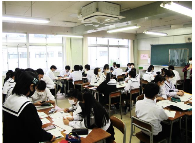
各班でインタビューに向けての最終準備です

自分たちが動いて手にすることができた貴重な機会なので、充実したインタビューにするためにもう一踏ん張りしてもらいたい。