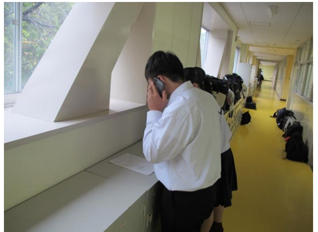
社会人サポーターと打ち合わせをしています