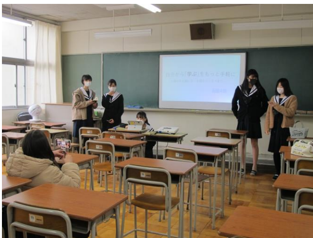
動画撮影のリハーサルの様子

来週はいよいよプレゼン大会の本選です。今年は大体育館での実施を断念し、動画で9チームが競います。その動画にもそれぞれのチームが創意工夫を凝らし、大詰めの作業が進められています。それぞれのチームがどんな発表をするのか、そして、どのチームに栄冠が輝くのか。来週の本番が楽しみです。