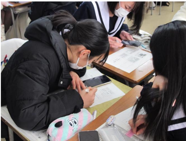
スマホの台本を見ながら、コメントを書いています

今週は冊子作りに取り組みました。今年の活動の集大成として、すべての班のポスター、インタビュー新聞、プレゼン資料をまとめて一冊の冊子を作ります。その冊子に載せるためのプレゼン資料にコメントを書きこみました。前回の発表のときに用いた台本を見ながら、各スライドに解説を書き込んでいきます。冊子が完成すれば、それぞれの班の今年一年の活動を見ることができます。完成を楽しみに待ちます。