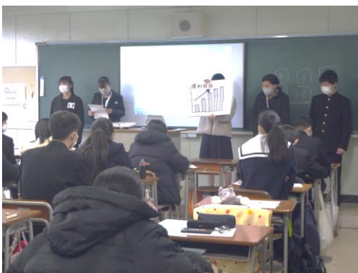
紙芝居形式のプレゼン