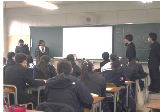
黒板を使ったプレゼン

今週は、プレゼン大会予選会です。これまでの活動の集大成！！ 1学期に個人で作った主張を、班に分かれて主張を深めてきました。 自分たちでアポイントを取り、社会人サポーターに質問したり、班 員5人の意見を出し合ったりしながら、この日を迎えました。