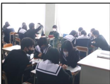
プレゼン大会に向けて協議中

プレゼンの目標は、「聴衆を惹きつけ、聴衆を動かす。」です。いかに聴衆を惹きつけることができるのかを考えて、活動してもらいたい。