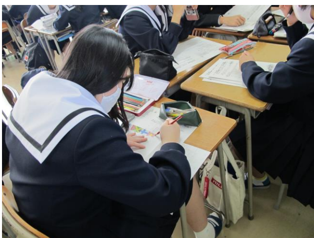
インタビュー新聞を製作中