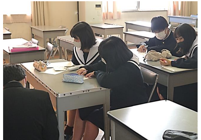
こちらは電話でのインタビューの様子です