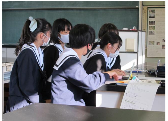
たくさん質問して、充実したインタビューでした

教室では、インタビューを終えた班が増えてきたので、インタビュー新聞の完成に向けて、協議を重ねていました。また、今週はプレゼンテーション活動の詳細が発表されたので、そのことについて協議をしている班も多く見られました。時間は限られているので、リーダーを中心として、計画を立て、行動してもらいたい。