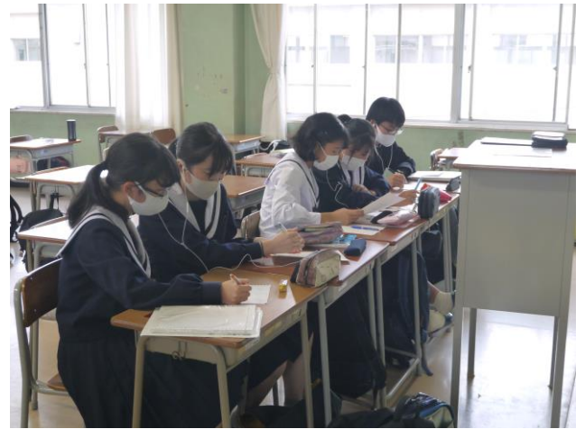
実際のインタビューの様子

社会人サポーターインタビュー第2回です。これまでに 行ってきた班からのアドバイスを元に、準備をしてインタ ビューに挑んでいた様子でした。始めは緊張した面持ちで したが、サポーターの方々の優しさに触れ、一生懸命イン タビューをしていました。インタビュー後は、緊張からの 解放とインタビューをやり遂げた達成感からとてもいい表 情をしていました。