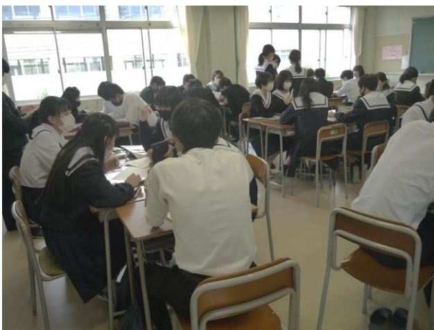
こちらは教室でワークを行っている班の様子です。

調べ学習班は、礼状を書いたり、インタビュー新聞の作 成に向けて、レイアウトを考えたり、まだインタビューが 終わっていない班はインタビューにむけての最終打ち合 わせをしていました。