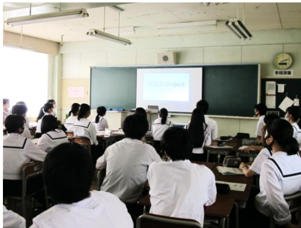
動画を見てこれからの活動の説明を受けています

このように社会と関わりを持つという貴重な経験を通して、自分たちの主張を深めていきます。